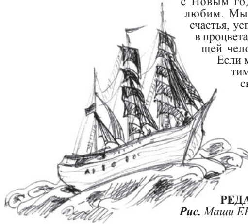
Рис. Маши ЕРМИЛОВОЙ.