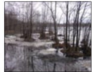
Рис. автора: существует легенда, что когда китежане смеются, над озером распускаются цветы.

ческой жизни народа, сердце которого столетиями жило и вдохновлялось взысканием Святого Града.