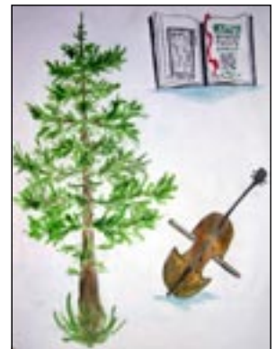
Рис. «Самое грамотное и музыкальное дерево» Маши ЛУКОЯНОВОЙ, члена экологического агитпункта «Зелёный Парус» д. Шалдёж Семёновского района.