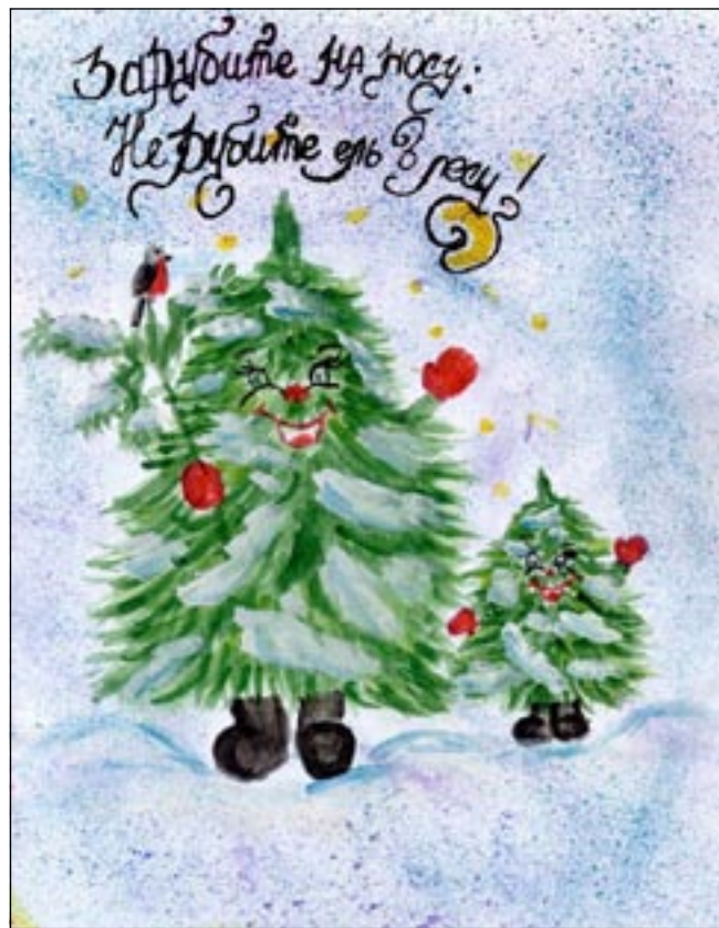
Плакат Ани ШАШКОВОЙ «В защиту ёлки», ученицы 7 кл. ср. школы д. Шалдёж Семёновского района.