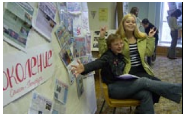
На снимках: производство очередных журналистских шедевров; газетное разнообразие фестиваля.

Но как бы то ни было, нельзя не снять шляпу (кепку, ушанку, треуголку) перед организаторами и спонсорами «Волжских встреч». Они знают, что делают и куда вкладывают деньги. Пожелаем им дальнейших удач и осуществления всех замыслов. А мы ещё вернёмся на «Волжские встречи» со свежими газетами и идеями.