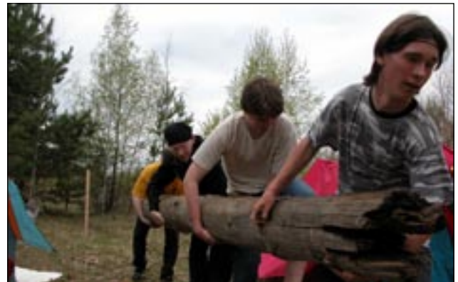
На снимках: театр теней; лагерь строится; я (автор) на «пионерском субботнике».