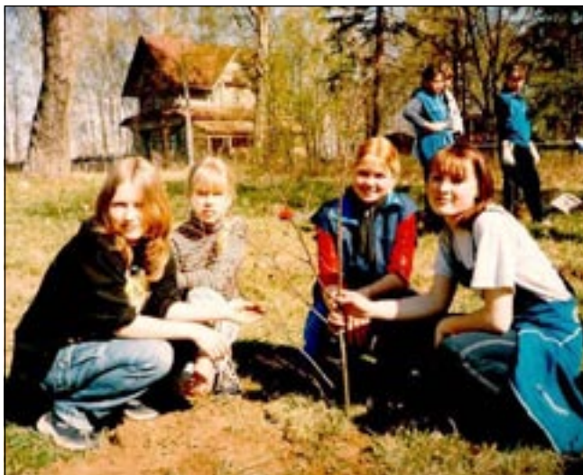
На снимке: мы и наши липки в аллее «Дружба», которую мы посадили в парке усадьбы Левашовых.