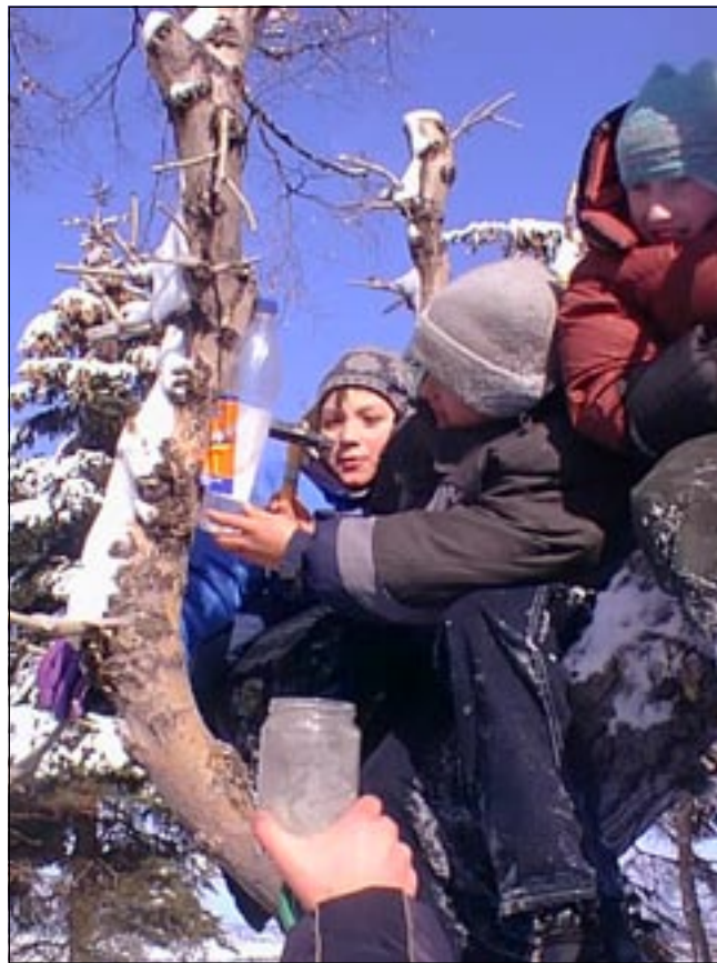
Вышли мы из подвала