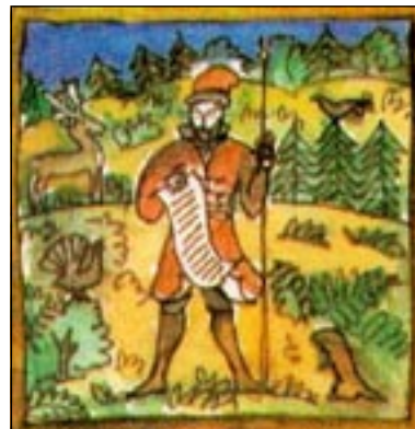
Рис. «Страж природы в древней Руси» из альманаха «Лес и человек» за 1986 г.