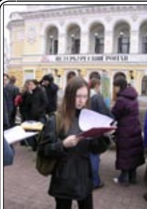
На снимке: сбор подписей против проекта нового Лесного Кодекса.

На снимке: жадные ручки, тугие кошельки выставляют Родину на торги.