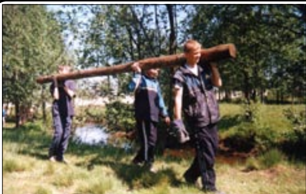
На снимке: юные чистильщики строят деревянный спуск к Пыре.