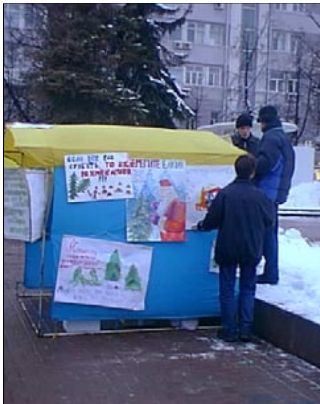
На снимке: защищаем ёлки! 28 декабря. Театральная площадь.